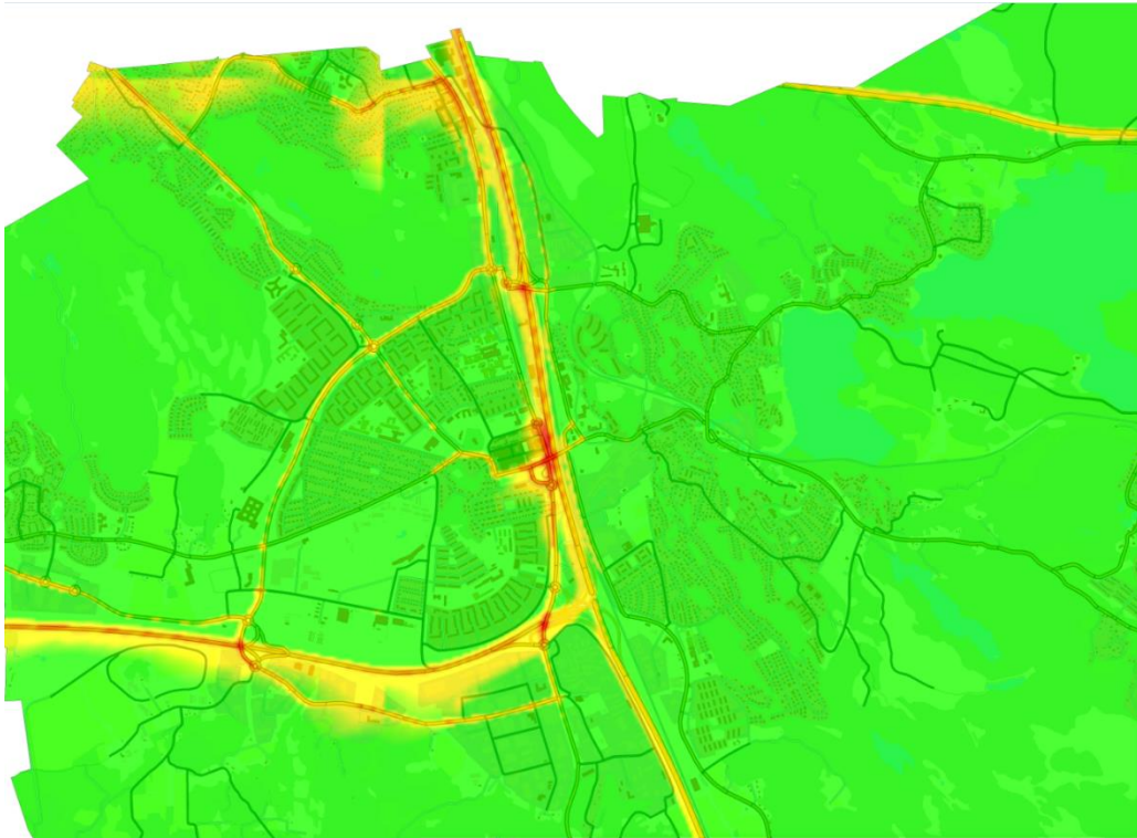
Figur 3. Beräknat timmedelvärde (98-percentil) för kvävedioxidhalter i Mölndals tätort i Mölndals kommun år 2015.