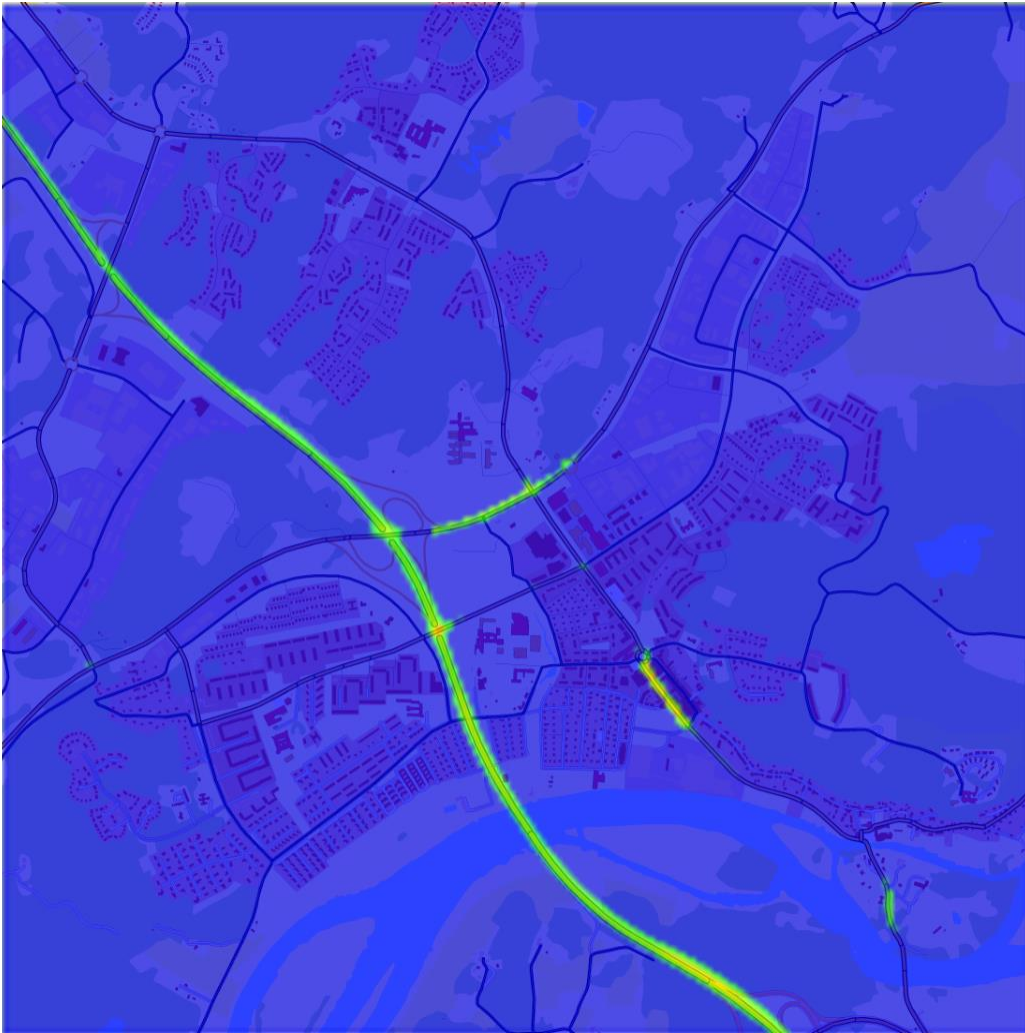
Figur 1. Beräknat årsmedelvärde för kvävedioxidhalter i Kungälv tätort i Kungälv kommun år 2015.